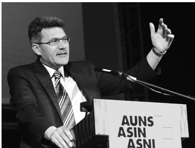
Nationalrat Dr. Pirmin Schwander, Präsident der Aktion für eine unabhängige und neutrale Schweiz (AUNS)

Liebe Mitglieder, Sympathisanten und Gönner der Aktion für eine unabhängige und neutrale Schweiz, liebe Gäste, sehr geehrte Damen und Herren