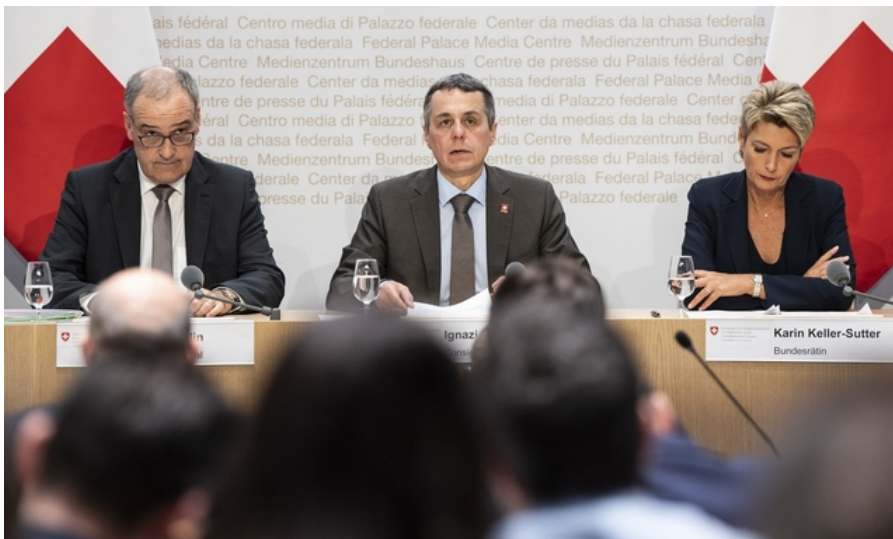
Die Bundesräte Guy Parmelin (links), Ignazio Cassis und Karin Keller-Sutter an der Pressekonferenz über das Rahmenabkommen im Juni 2019.

Die Haltung des Bundesrates zum Rahmenabkommen ist riskant – und unehrlich.